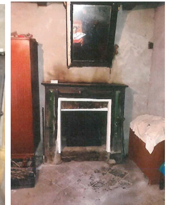
Après: installation insert